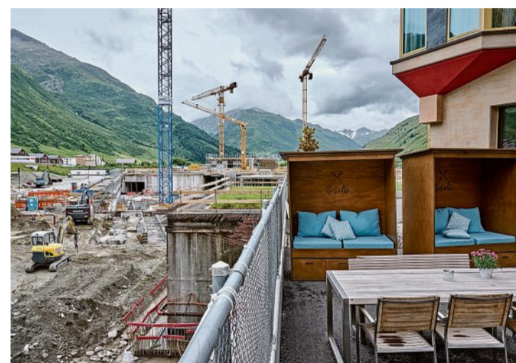
Wer sich dem Dorf nähert, sieht zuerst die Baukräne: Neubaugartier in Andermatt.