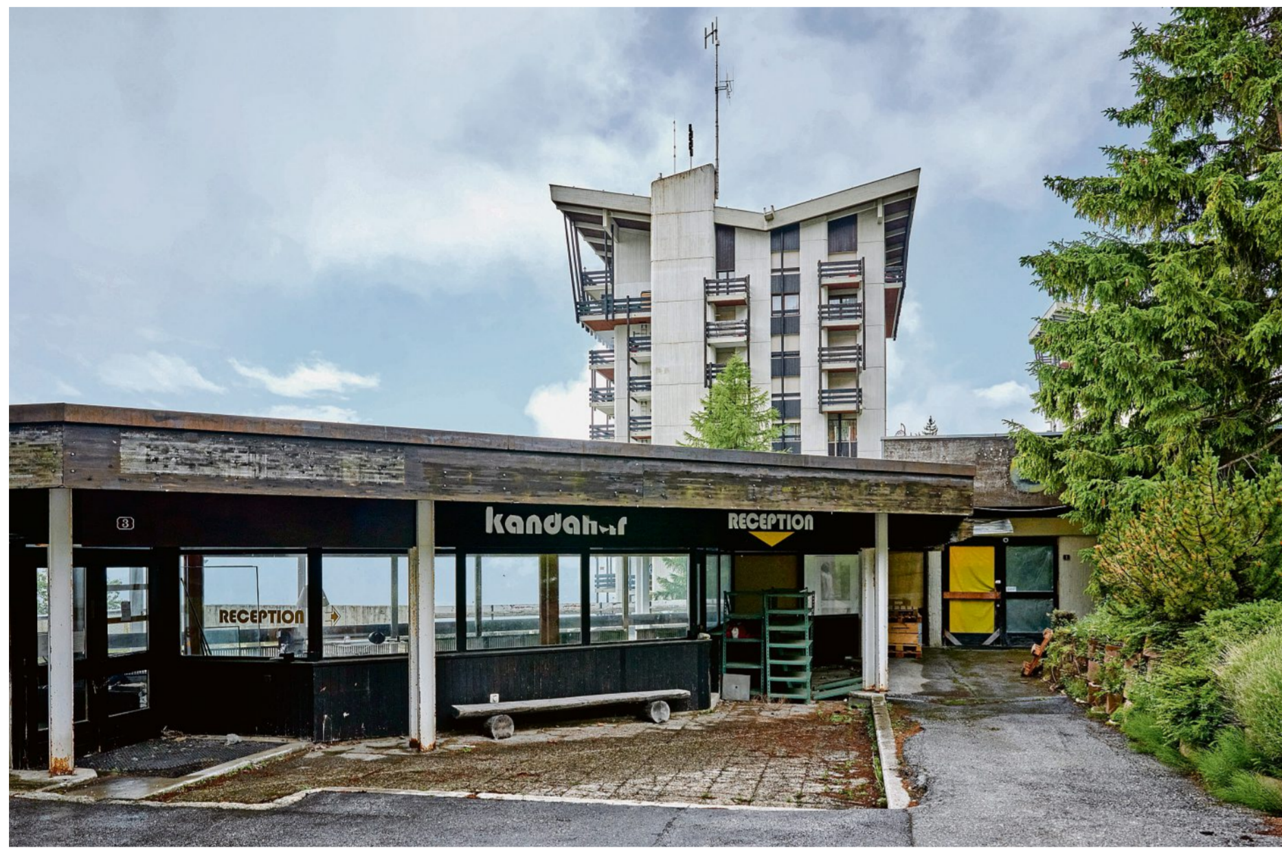
Wucherndes Unkraut, abblätternde Schriften, leere Ladenflächen – und im Hintergrund die Wohntürme aus den Siebzigern: Das verwahrloste Resort Aminona bei Crans-Montana.