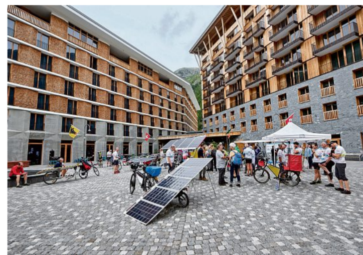
An Veranstaltungen nehmen meist Auswärtige teil: Event auf der Piazza Gottardo in Neu-Andermatt.

Mit der Investitionstätigkeit steigen auch die Wohnkosten Die Finanzkrise hat auch die Entwicklung des Resorts in Andermatt vorübergehend ins Stocken gebracht. Aber sowohl der Investor als auch die Planung und der