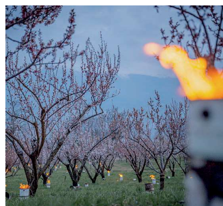
Frostkerzen brennen am Montagmorgen in einer Aprikosenplantage in Baar (Nendaz).

Pankraz, Servaz und Bonifaz sind jeweils vom 11. bis am 15. Mai.