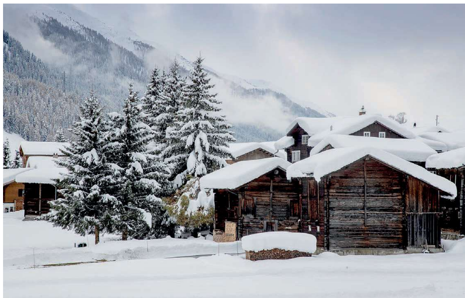
Zweitwohnungen in Tourismusregionen wie dem Obergoms sind seit Ausbruch der Pandemie begehrt.

beratung mit Sitz in Zürich. Das Unternehmen berechnete die Kosten und Erträge der Zweitwohnungen auf Basis der Obergommer Gemeinderrechnung 2020 und unterteilte sämtliche Posten gemäss Relevanz für die Zweitwohnenden in Kategorien. Zwei Beispiele: Die Kosten für Bildung und Soziale Wohlfahrt wurden nur den Erstwohnenden zugewiesen. Die Aufwände pro Kopf für Verkehr oder touristische Standortentwicklung wurden den Erst- und Zweitwohnenden gleichmässig angerechnet.